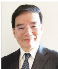
周璋生 (立命館大学政策科学部教授)

工学博士(京都大学)、エネルギー環境政策学・政策工学専攻。新エネルギー・産業技術総合開発機構(NEDO)研究員、地球環境産業技術研究機構(RITE)主任研究員・研究顧問、立命館サステナビリティ学研究所長、日本工学会アカデミー Foreign Fellow等歴任。著書(共著)に「SDGs時代のサステナビリティ学」(法律文化社、2022)等多数。